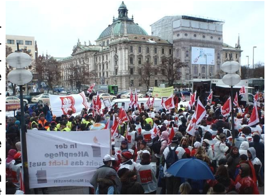
Mitglieder der ak.mas zeigen sich bei einer Kundgebung von ver.di in München solidarisch mit den Tarifforderungen im öffentlichen Dienst

Die Mitarbeiter fordern in der Tarifrunde 10/11 fünf Prozent mehr Geld für alle, mehr Geld für Dienst zu ungünstigen Zeiten, eine bessere Anerkennung von Berufserfahrung bei Neueinstellungen und eine attraktive Altersteilzeitregelung. Sie sind dafür schon auf die Straße gegangen und bereiten weitere öffentlichkeitswirksame Aktionen vor. Die Dienstgeber mahnen, in der derzeitigen Wirtschaftskrise Maß zu halten. Eine rasche Einigung sei nötig, um nicht schwer refinanzierbare Rückwirkungen in Kauf nehmen zu müssen, im Osten aber, so vermehren sie gleichzeitig, gebe es überhaupt keine Gehaltserhöhung. Der öffentliche Dienst hat maßvoll mit insgesamt 2,3 Prozent Gehaltserhöhung, einer Altersteilzeitregelung und Vereinbarungen zu weiteren Tarifreformen bereits abgeschlossen. Der mit ver.di konkurrierende Marburger Bund fordert ebenfalls 5 Prozent Gehaltserhöhung, verhandelt zurzeit und droht bei Scheitern mit Streik.