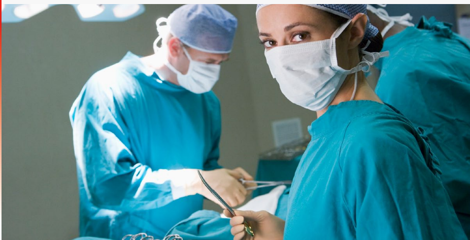
50 Prozent der Ärzte leisten mehr als vier Bereitschaftsdienste im Monat. Umfrage des Marburger Bundes unter seinen Mitgliedern, 2013

Noch nicht alle der sechs Regionalkommissionen der Arbeitsrechtlichen Kommission (AK) haben den Grundsatzbeschluss der Bundesebene zur Ärzte-Tariferhöhung und Neuregelung der Bereitschaftsdienste vom 26. März 2015 umgesetzt. In zwei Regionen wollen die Caritas-Arbeitgeber die Vergütungserhöhung zeitlich verschieben.