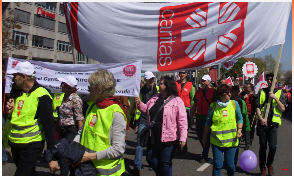
Caritas-Beschäftigte demonstrieren in Stuttgart mit den Kolleg(innen) aus dem Sozial- und Erziehungsdienst im öffentlichen Dienst.

Ministerin Nahles betont, die Stärkung der Tarifbindung von Arbeit sei ihr ein wichtiges politisches Anliegen. Dafür müssten auch die Kirchen als Träger von Flächentarifen gestärkt werden. Als Tarifgestalter bei der Caritas nehmen wir die Bundesregierung beim Wort! Wir wollen die politische Trendwende für die Tarifbindung nutzen.