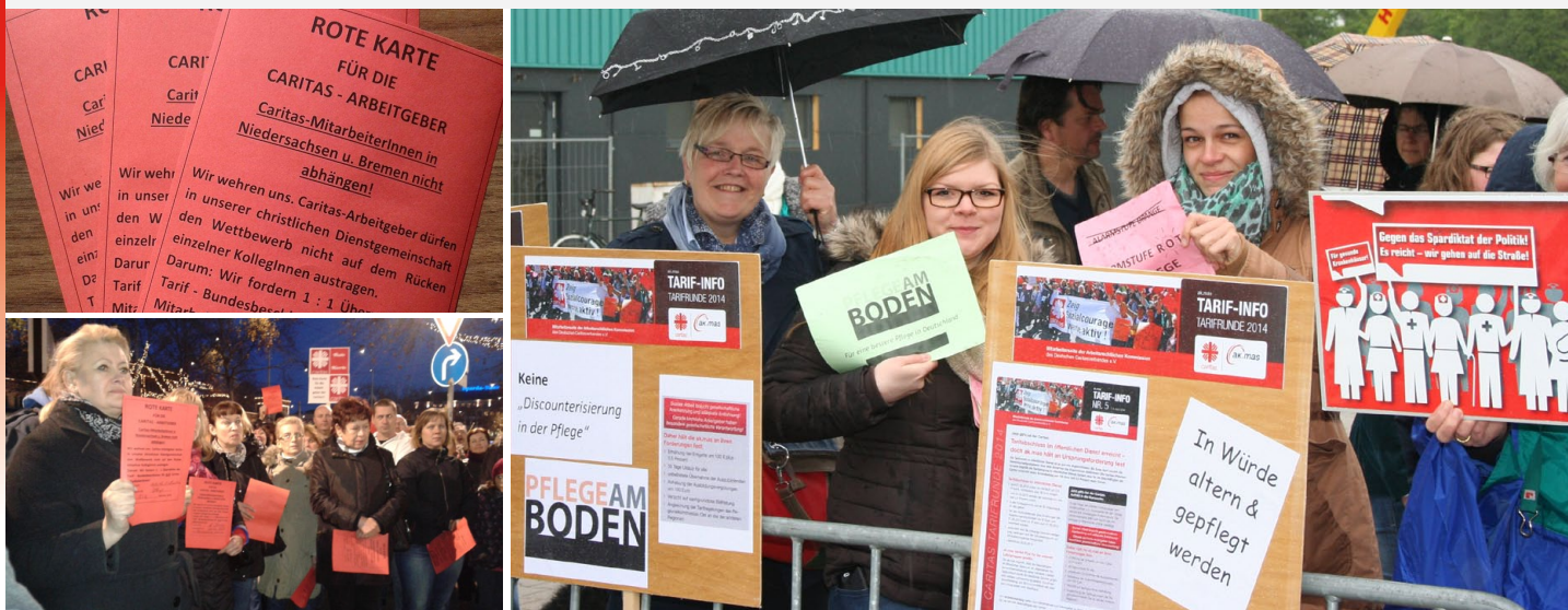
Überredungskunst, Ausdauer und Mut: Caritas-Mitarbeiter(innen) haben über Wochen im Norden demonstriert.

Wir waren es nicht gewohnt, für unseren Tarif einstehen zu müssen. Vorher war es einfach: Unsere Caritas-Arbeitgeber haben den Tarif aus dem öffentlichen Dienst übernommen. In der vergangenen Tarifrunde war es erstmals anders. Sie wollten den TVöD nicht übernehmen und sogar die Löhne bei der stationären Altenpflege senken. Da mussten wir protestieren – zum ersten Mal!