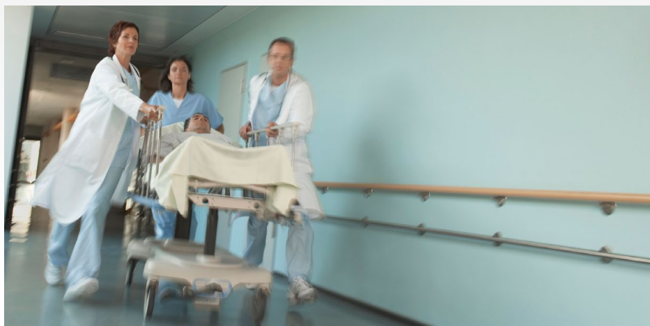
Krankenhäuser sind während der Nacht personell teilweise gefährlich unterbesetzt. ver.di-Nachtdienst-Check, März 2015

Zudem hat eine von ver.di im März 2015 bundesweit erhobene Stichprobe in 225 Krankenhäusern (der sogenannte Nachtdienst-Check) gezeigt, dass die Krankenhäuser während der Nacht personell zum Teil gefährlich unterbesetzt sind. In mehr als der Hälfte aller Fälle muss eine Pflegekraft allein 25 Patienten versorgen. „Höchst bedenklich“ laut ver.di sei die Besetzung gerade auf den Intensivstationen, wo im Durchschnitt 3,3 Patienten von einer Pflegekraft betreut werden. Fachgesellschaften für Intensivmedizin empfehlen die Versor-